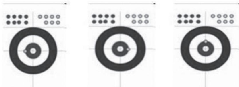
图 5-2 目标壶位置示意图

(2) 评分标准：考评员参照冰壶击打评分细则（表 5-3）进行评分，取 3 次成绩中最好的 1 次成绩，再按项目权重换算成相应分数。