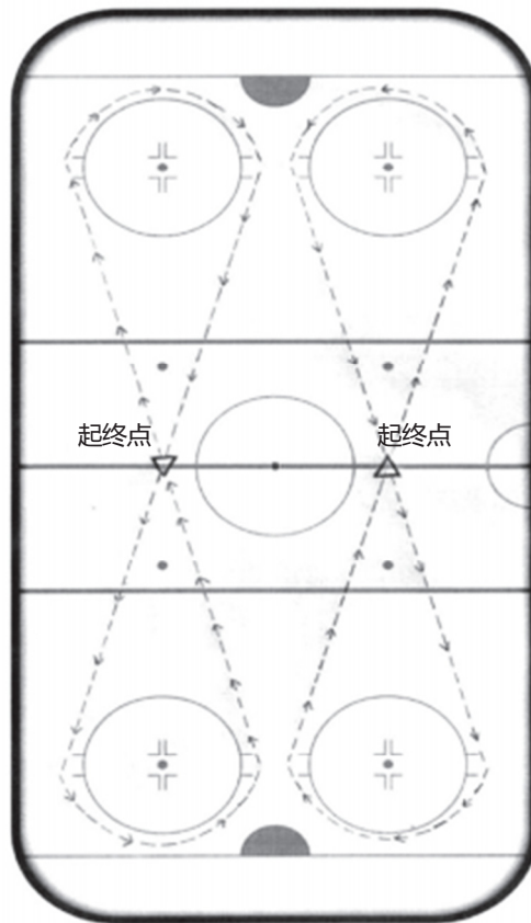
图 4-2 冰球“8”字滑行(速度耐力)示意图